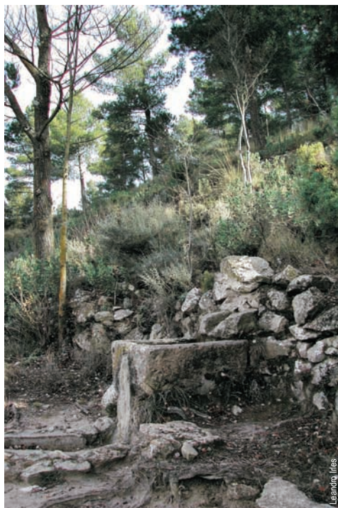
Fonteta Soriano, Biar

entidad promotora: C. Excursionista Colivenc