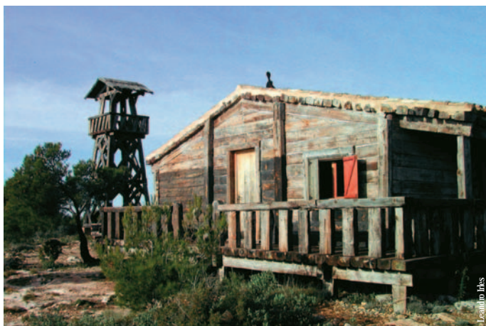
Refugio del Blanquinal, Beneixama